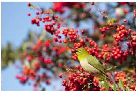
題名：ある晴れた春の朝

赤い木の実を食べにメジロがやってきました。気づかされると逃げてしまうので、車の中に隠れてチャンス待ちました。