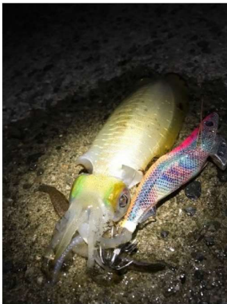
題名： 釣果 アオリイカ①

昨年の夏に釣ったアオリイカです。初めて大きいサイズを釣ったので、シャッターを切りました。