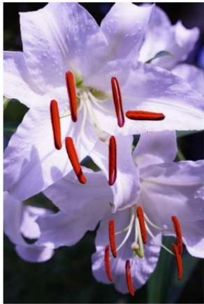
題名：カサブランカⅠ・Ⅱ

コロナ禍のため、旅行などの遠出の撮影は皆無となり、行き着いたのが自宅の庭です。カサブランカは、妻が愛情を込めて育てています。花の美しい造形に魅了されました。